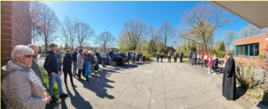
Beisammensein nach dem Ostergottesdienst mit ukrainischen Gästen und deutschen und ukrainischen Osterbräuchen