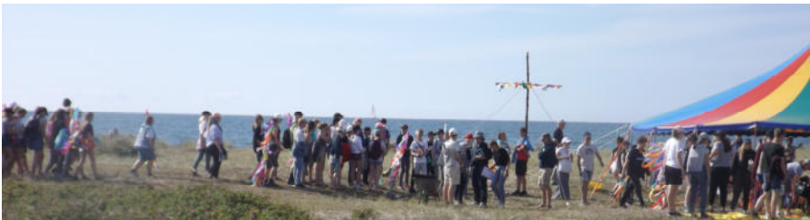
Der Taufgottesdienst am Flügger Strand auf Fehmarn. Auch ein Bargfelder Konfi wurde in der Ostsee getauft.