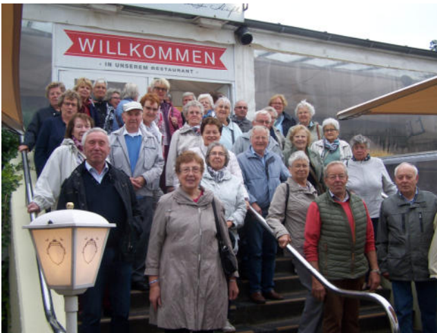
Die meisten Mitreisenden des Seniorenausflugs nach getaner Arbeit am Willkommhöft in Wedel-Schulau