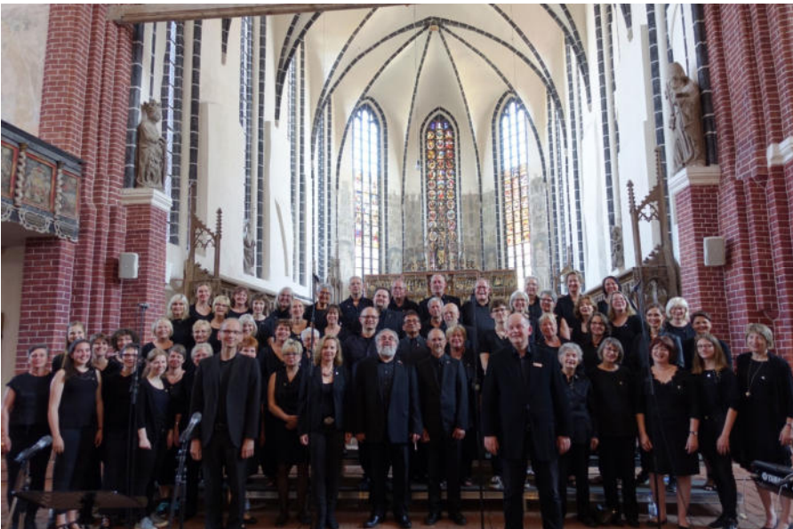
German Folk & Gospel Choir

Das Abschlusskonzert war bei der Planung im letzten Jahr noch für den Samstag vorgesehen. Es findet nun aber am Sonntag, 27. Oktober um 18 Uhr in der Kirche statt. Der Eintritt ist frei, aber Spenden zugunsten der Kirchenmusik Bargfeld und dem Erhalt der Orgel sind gerne gesehen.