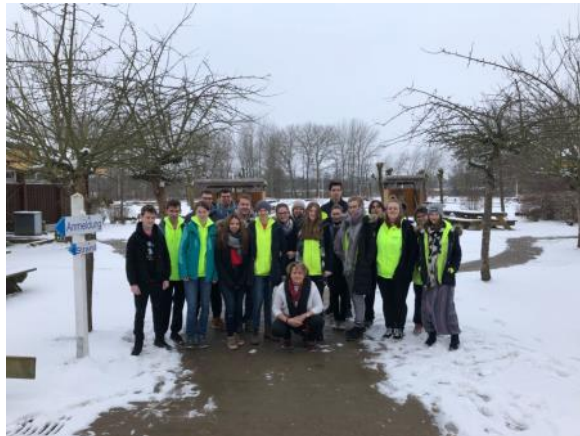
Es ist kalt, aber die Bargfelder Teamer sind heiß auf den Kongress.

Es leuchtet, es strahlt, und es singt, hüpf, tanzt und schreit Rudel in Pink/gelb