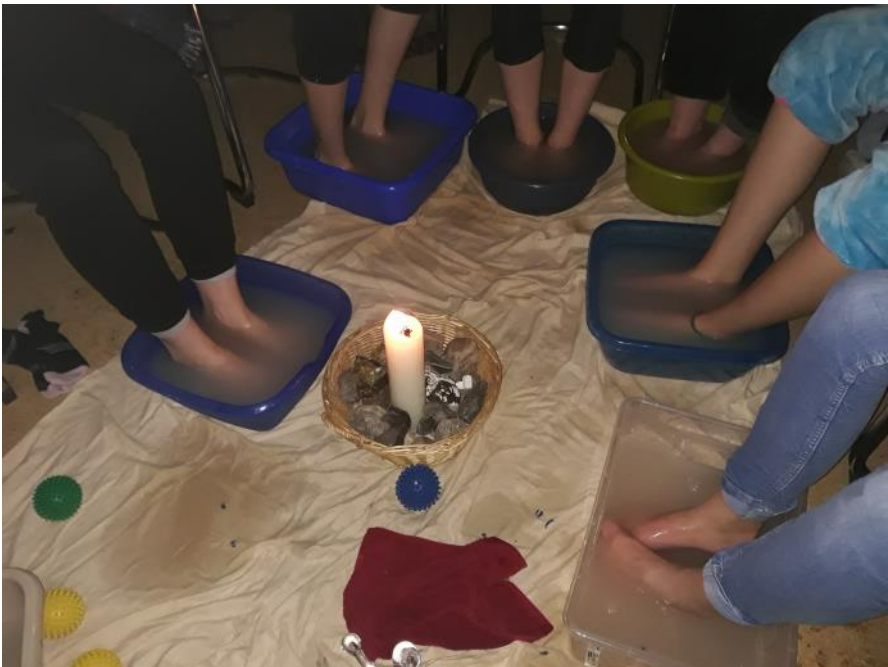
Entspannung für müde Mädchenfüße