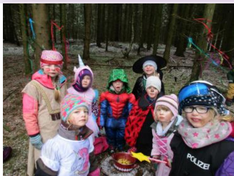
Fasching im Wald

dann im nächsten Kirchenblatt ausführlicher.